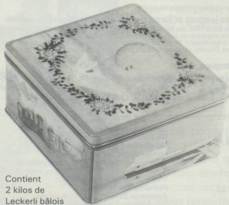
Contient 2 kilos de Leckerli bâlois

Dans les prix indiqués, tout est compris, soit les frais de port, l'emballage et l'assurance. Pour le paiement, veuillez joindre à la commande un chèque encaissable en Suisse ou effectuer le versement par poste, banque, ou solliciter vos amis helvétiques. Nous nous réjouissons de pouvoir vous adresser très bientôt un cordial bonjour de Bâle.