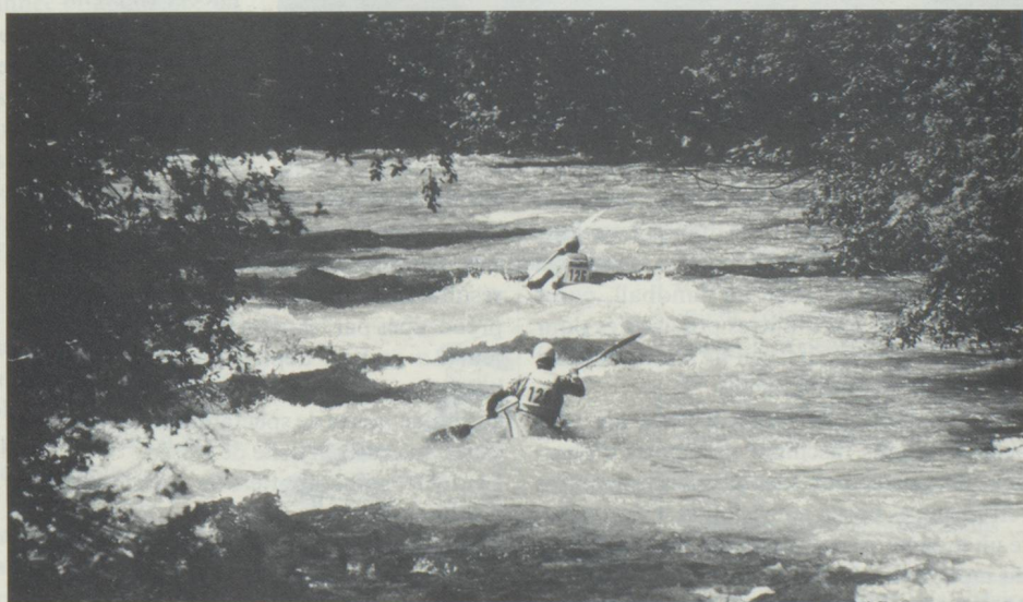
* Descente nationale en eau vive, Saanen, (Oberland Bernois), 27/28 juin 1987.