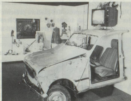
L'exposition «Le mal et la douleur» au musée d'ethnographie de Neuchâtel.