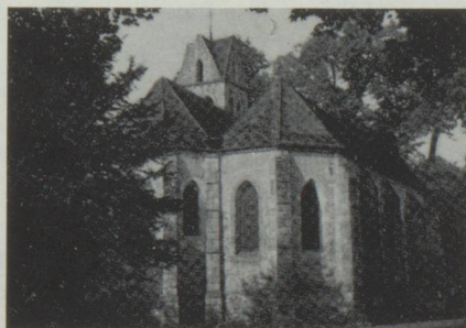
La chapelle est du XII e siècle.

En 1974 : Commence la restauration totale du château qui reçoit les visites de Giorgio de Chirico et de Salvador Dali.