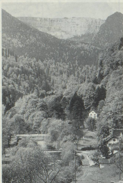
Les Gorges de l'Areuse

Un livre qui plaira aux Neuchâtelois et ils sont nombreux en France