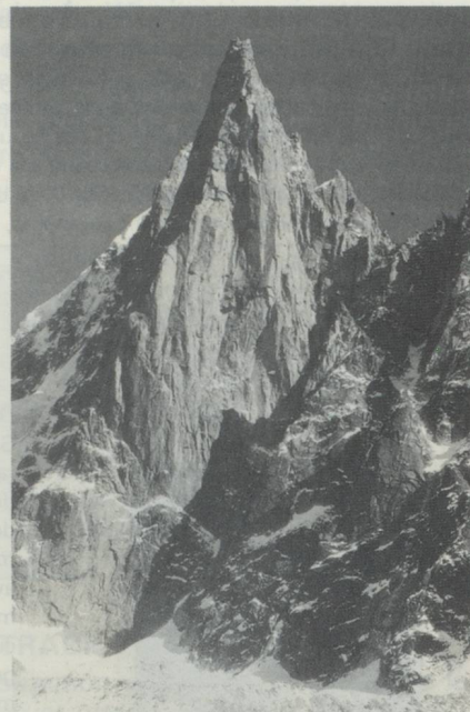
Le Mettelhorn au dessus de Zermatt et un site idéal pour photographier la silhouette traditionnelle du Cervin

Panorama des Alpes vient de paraître aux Editions 24 heures . Un livre de 168 pages, au grand format 34 x 30 cm, illustré de 110 photographies, toutes en couleurs et la plupart en format panoramique de 2 à 4 pages (soit jusqu'à 128 cm de long), 30 cartes géographiques en 4 couleurs, graphiques avec indication des sommets illustrés. Livre relié, sous étui. Edition normale : prix Fr. 149.-S. Edition de luxe : prix Fr. 179.-S. En vente aux Editions 24 heures, avenue de la Gare 33, 1001 Lausanne, tél. 021/49.45.49.