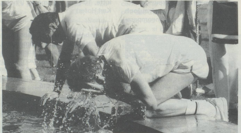
Après l'effort, les rafraîchissements

De bons soins font la moitié de la victoire