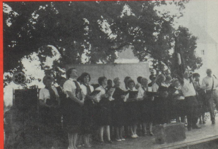
L'Union Chorale Suisse de Paris.