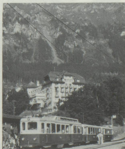
Depuis Wengen, le chemin de fer à crémaille conduit les touristes à la Petite Scheidegg, puis jusqu'au Jungfrauoch/Oberland bernois.

Prix par personne en demi-pension, chambre double avec bain de FF 2 700 à FF 5 428 * - dépliant spécial auprès du Tourisme Suisse, 11 bis, rue Scribe - 75009 Paris