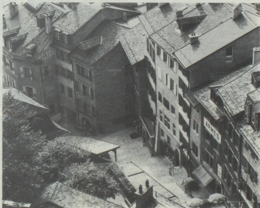
Lausanne. Une des liaisons les plus fréquentées entre la haute et la basse ville passe par les Escaliers du Marché recouverts de bois.

Que coûte la carte suisse de vacances et où peut-on se la procurer ?