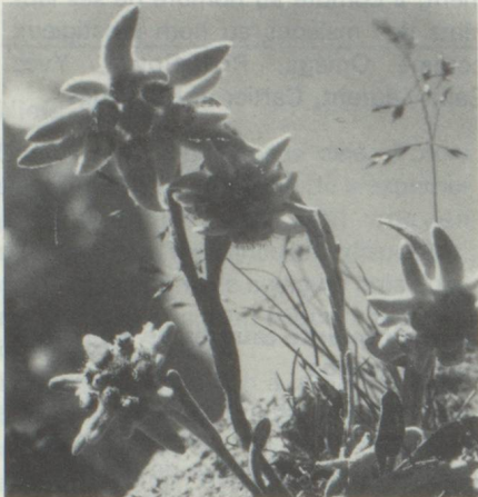
« Edelweiss » fleur des alpes