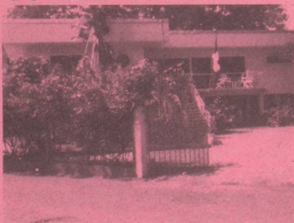
Ambassade Donka Conakry II B.P. 720 Conakry I Tél. : 46.26.12 CONAKRY