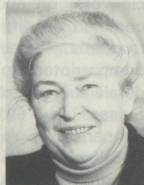
Esther Bühler Conseillère aux Etats, membre de la Commission des Suisses de l'étranger