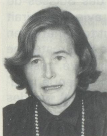
Elisabeth Kopp Conseillère fédérale