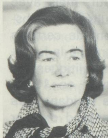
Monique Bauer Conseillère aux Etats