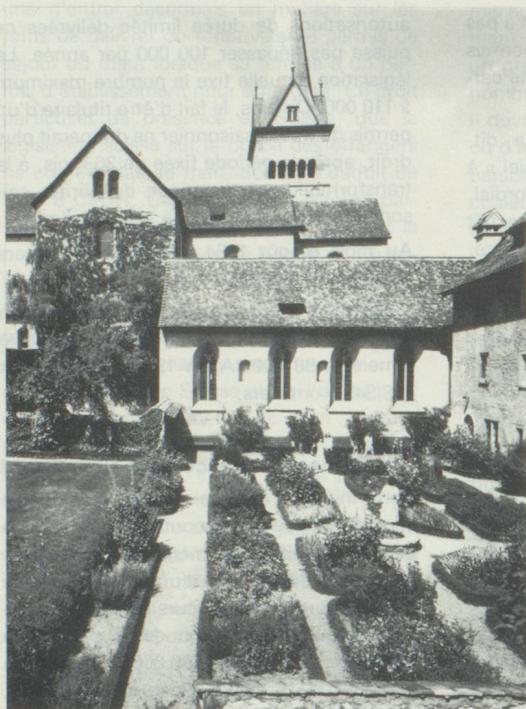
Schaffhouse, au coude du Rhin/Suisse orientale

L'ancienne abbaye bénédictine d'Allerheiligen (Tous-les-Saints) est aujourd'hui un musée historique et culturel. Dans la cour orientale du couvent, un musée des plantes médicinales et des épices a été aménagé selon un modèle du Moyen Age