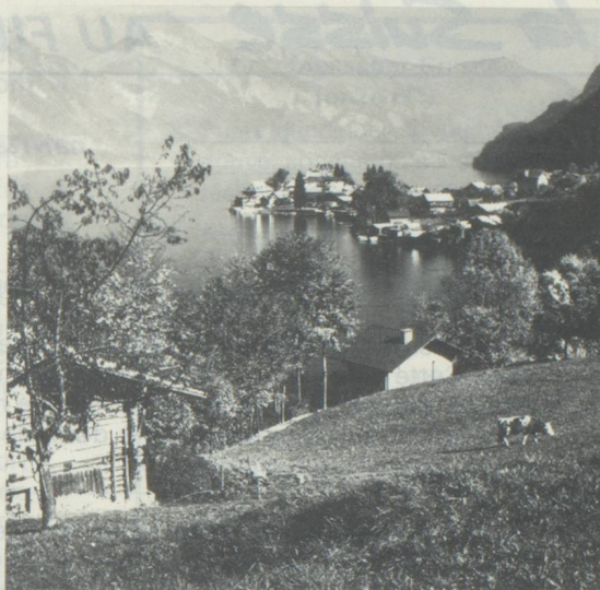
Loin du trafic, Iseltwald est une station tranquille du lac de Brienz/Oberland bernois