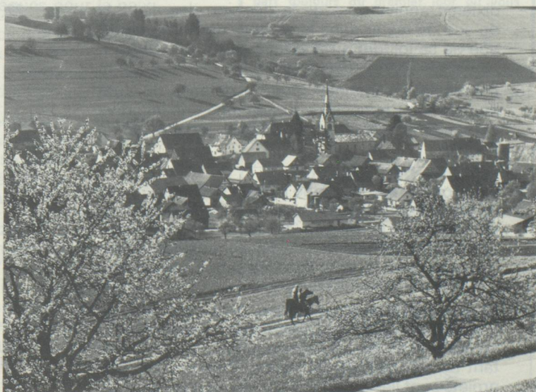
Schleitheim, dans le canton de Schaffhouse

Le village viticole avec ses belles maisons à colombage est situé entre les hauteurs du Randen et la frontière.