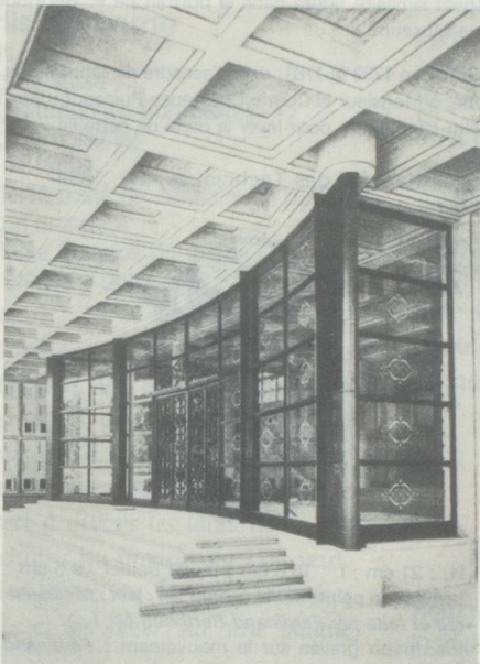
Université de Fribourg (Suisse)