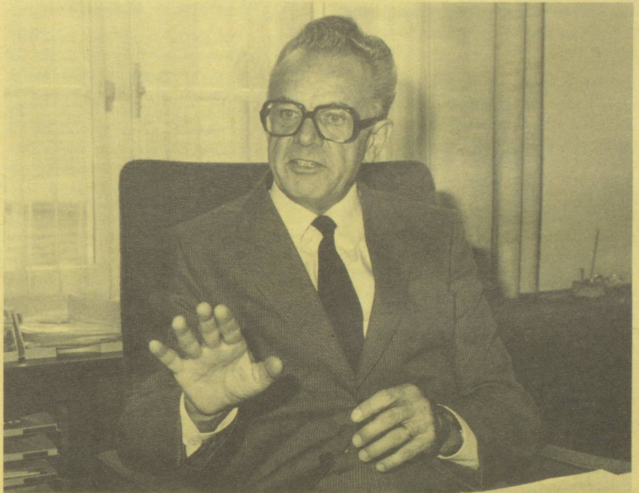
M. Léon Schlumpf, Président de la Confédération.