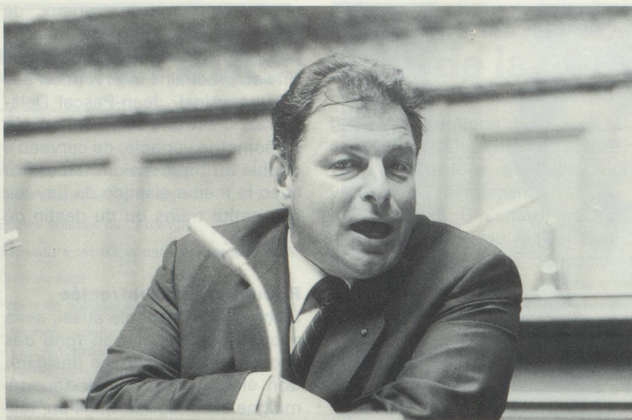
M. Jean-Pascal Delamuraz, Conseiller fédéral

vocabulaire, aime utiliser le terme «synergie» et tabler sur l'effet d'entraînement qu'il signifie. On peut se demander parfois s'il n'est pas entraîné lui-même par son propre mouvement, jusqu'à risquer de trébucher. D'où le reproche entendu de se disperser. L'homme d'Etat doit certes rester généraliste, mais il ne saurait être touche-à-tout.