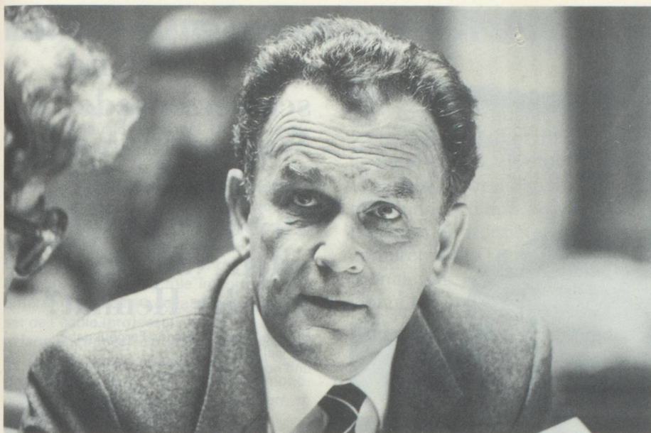
M. Otto Stich, Conseiller fédéral

liticien charismatique, ce n'est pas un orateur, harangueur de foules (il est même piètre orateur). Mais c'est un travailleur acharné, qui a tissé, sans crier gare et sans éclat, une carrière politique solide qui vient de le porter à la magistrature suprême. Il a un trait commun avec Willi Ritschard: le Suisse moyen se reconnaîtra en lui.