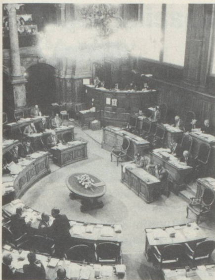
Salle du Conseil aux Etats.

Fédération suisse des cheminots, socialiste, un Valaisan!) au côté du radical biennois Raoul Kohler et de trois antiséparatistes du Jura bernois: le démocrate du centre Jean-Paul Gehler, les radicaux