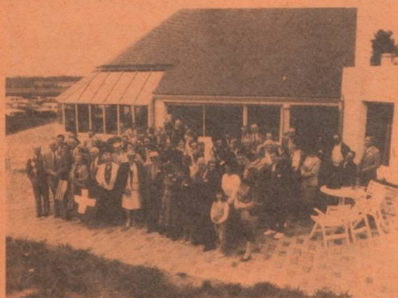
Entourant M. le Consul, tenant l'emblème helvétique, près d'une centaine de compatriotes étaient à Taden (C.d.N).