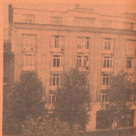
Consulat de Suisse 124, bd de Strasbourg 76050 LE HAVRE CEDEX ☎ (35) 42.27.09