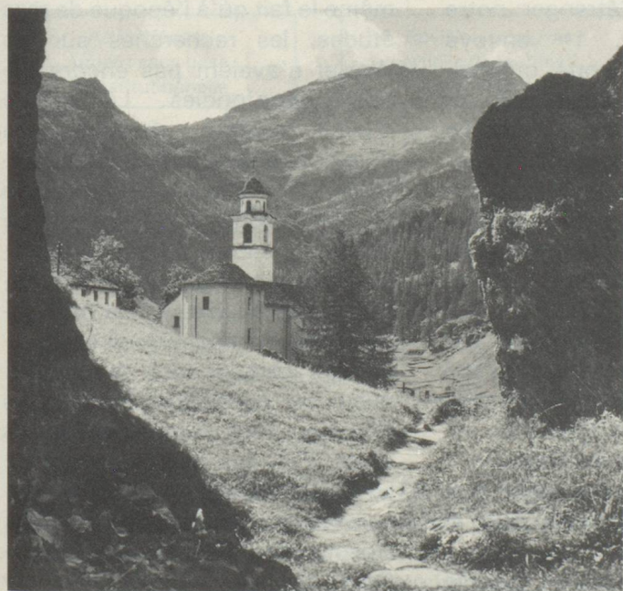
L'église de Bosco-Gurin