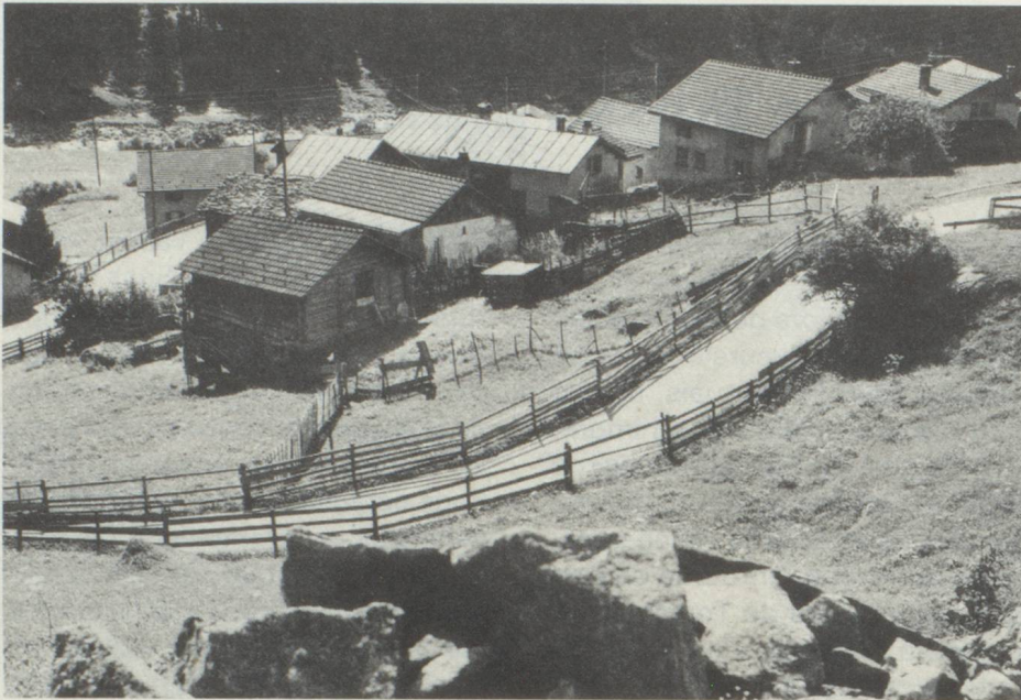
Vue du village d'Ausserferrera dans le val d'Avers, Grisons.

escaladant les Alpes en direction du Sud jusqu'au Tessin, au val d'Ossola et de chaque côté du Mont Rose, dans les vallées transversales du nord de la vallée d'Aoste. De petits groupes épars s'avancèrent finalement jusqu'en Savoie, comme l'indique, par exemple, le nom bien significatif de ce petit coin au Nord de Chamonix, «Les Allamands». Des colonies de Walser s'étendirent ainsi dans les Alpes sur une longueur de plus de trois cents kilomètres d'Ouest en Est. Une autre colonie walser sur sol français se trouvait à Vallorcine, dans la partie la plus haute de la vallée du Trient.