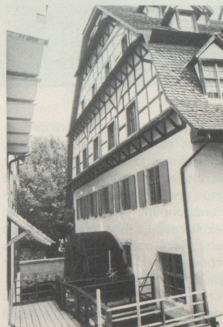
La roue hydraulique du Moulin à papier, Bâle.

loir mène au premier étage. On peut voir, dans la salle donnant au sud, un aperçu de l'histoire de l'écriture et de l'alphabet ainsi qu'une exposition sur les écritures non alphabétiques. Les salles situées à l'est et au nord révèlent au visiteur les plus anciennes écritures alphabétiques sémitiques ainsi que les écritures grecque et romaine, et la salle d'apparat couverte de boiseries des Gallician les écritures du Moyen Age. Un aperçu de l'évolution de l'écriture jusqu'à nos jours y est également présenté.