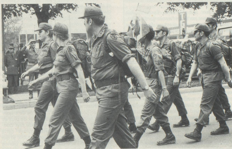
L'armée US participe à la marche de deux jours.