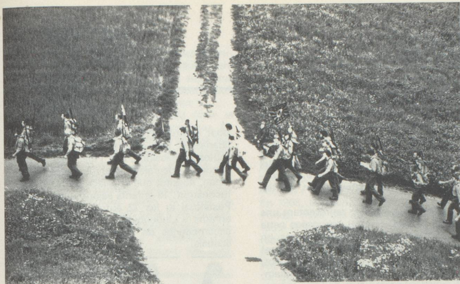
L'ours de Berne, fait lui aussi sa randonnée printanière.