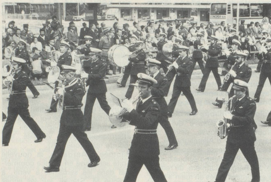
Une des fanfares encourageant les participants à cette marche de deux jours par un air entraînant.

vaut la peine de réserver le week-end des 14 et 15 mai 1983 pour un voyage à Berne.