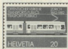
20 c. Centenaire du tramway à Zurich