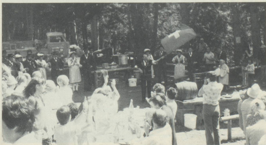
Un groupe folklorique agrémente l'excursion du dimanche.

L'après-midi fut consacré à divers problèmes et avant tout au message du Conseiller fédéral Aubert qui rendit son auditoire attentif au travail de son Département, actuellement préoccupé par les relations de la Suisse avec l'ONU. Il défendit la thèse de l'interdépendance internationale toujours croissante, à laquelle la Suisse ne peut se soustraire, son adhésion à l'ONU s'avère nécessaire dans le cadre de la politique extérieure traditionnelle et pragmatique. Au début, les relations extérieures de