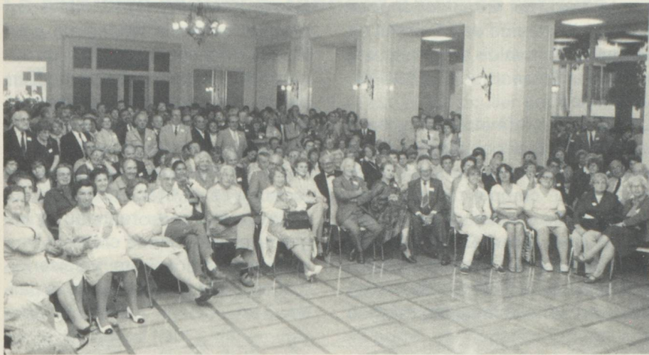
Pendant l'ouverture officielle.