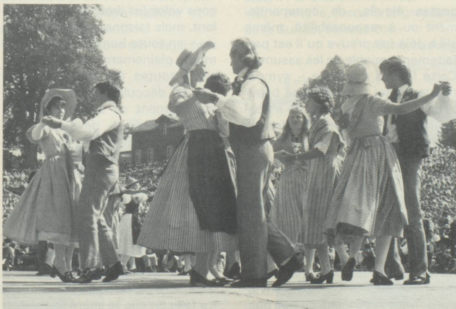
La danse populaire est encore très vivace en Suisse.

Cette situation a des effets paralysants autant sur le plan politique que professionnel. Si la consultation mutuelle forme la base de