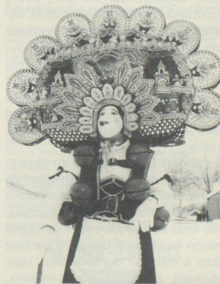
La St-Sylvestre du calendrier Julien à Urnäsch.