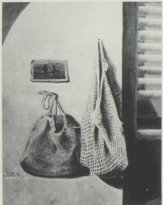
Norbert Clément «L'Angélu» (Pérou)