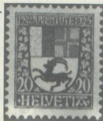
Canton des Grisons