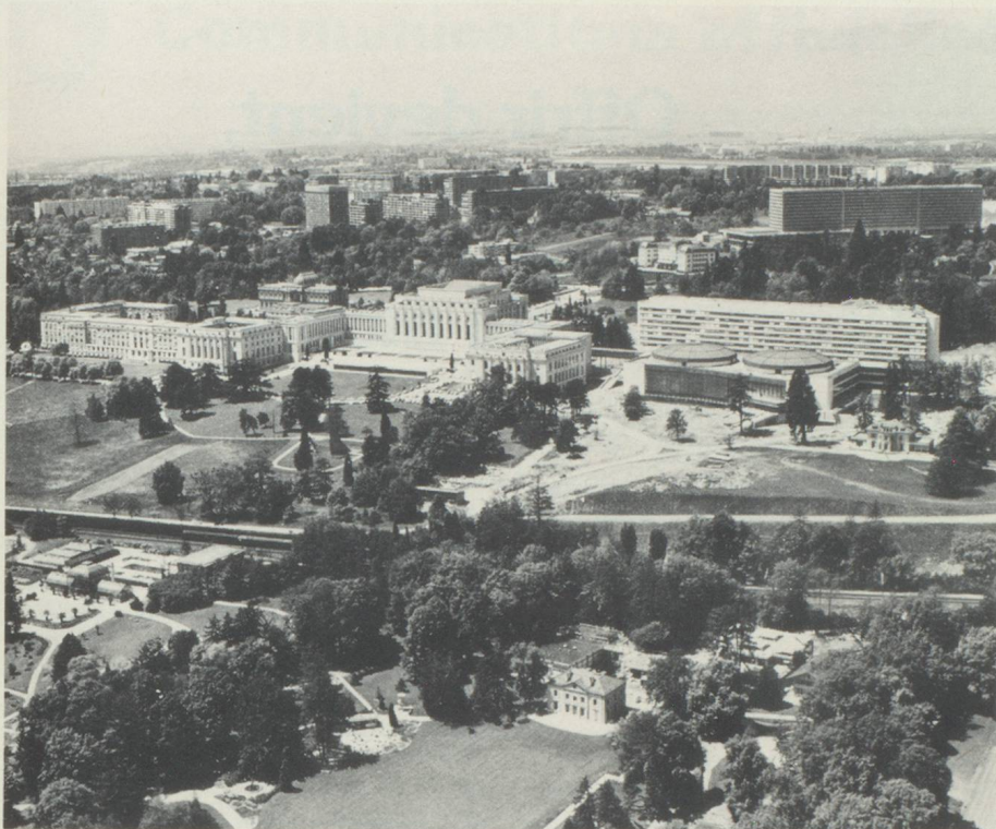
Les office de l'ONU à Genève

long terme accomplir un travail efficace. Il est devenu nécessaire de prendre part de manière continue aux travaux des Nations Unies afin de pouvoir suivre les problèmes du début à la fin. Nous devons aussi être à même de réaffirmer nos vues et de faire progresser les conceptions auxquelles nous sommes attachés. C'est ainsi que notre absence volontaire de l'ONU nous fait courir le risque d'un isolement qui ne peut que desservir nos intérêts. La raison nous commande donc de prendre une part entière à la coopération politique, économique et sociale qui se déroule au sein de l'ONU. Nous pourrions ainsi mettre fin aux inconvénients qui résultent pour nous, aujourd'hui, du fait que notre participation y reste limitée dans divers domaines. Nous serons en mesure de mieux défendre nos intérêts et de présenter nous-mêmes directement notre politique à la communauté des Etats. Ceci est d'autant plus important que nous avons toujours considéré qu'une participation ac-