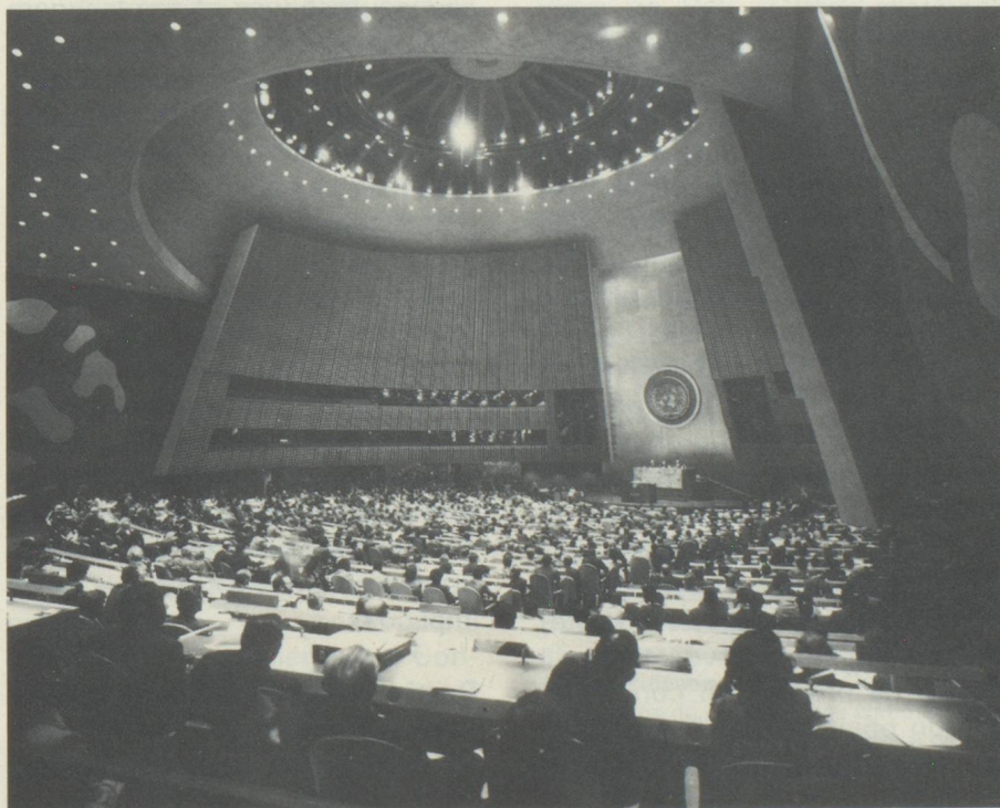
L'Assemblée plénière de l'ONU

tions établies par la Charte, ainsi que sur la politique de la Suisse à l'ONU. Selon le chapitre VII de la Charte, il incombe au Conseil de sécurité, en cas de menace contre la paix, de rupture de la paix ou d'acte d'agression, de prendre des mesures collectives contraignantes, de nature militaire ou non militaire. Une telle décision requiert l'accord des cinq membres permanents du Conseil de sécurité – Chine, France, Grande-Bretagne, Union soviétique et Etats-Unis – qui disposent chacun du droit de veto. La participation de la Suisse aux mesures militaires prévues à l'article 42 de la Charte ne saurait entrer en considération, parce qu'elle serait contraire au droit de la neutralité. Conformément à l'article 43, aucun Etat ne peut toutefois être contraint, de manière automatique, à participer à des sanctions militaires; au contraire, le Conseil de sécurité doit, dans tous les cas, conclure avec l'Etat en question un accord particulier sujet à ratification. De plus, le conseil de sécurité a le pouvoir, selon l'article 48,