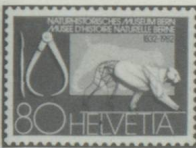
150 e anniversaire du Musée d'histoire naturelle, Berne