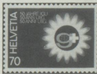
Centenaire de l'Union internationale de l'industrie du gaz