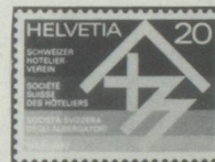
Centenaire de la Société suisse des hôteliers

Schweiz Suisse Timbres-poste spéciaux | 1982 Jour d'émission