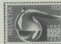
Centenaire de la Société suisse des industries chimiques