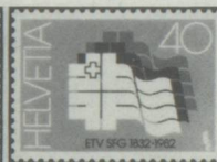
150 e anniversaire de la Société fédérale de gymnastique