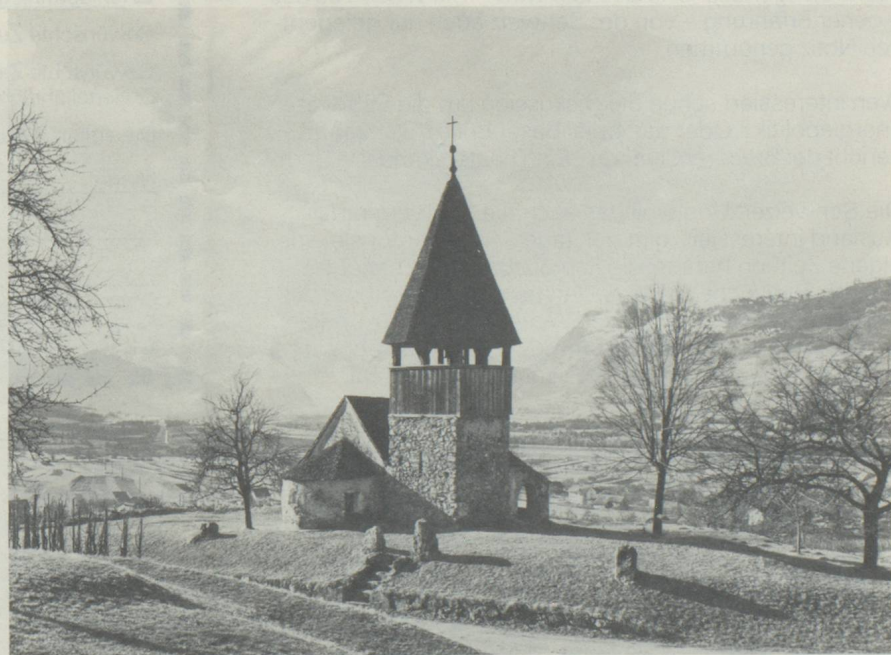
La chapelle de Triesenberg

trouvait à côté des nobles, les couvents de Saint-Gall et de Weingarten. De son côté la famille princière du Liechtenstein fit également des offres. Il est possible de suivre l'évolution de la noblesse du Liechtenstein dès le 12 e siècle, dont l'influence à la cour de Vienne trouva son apogée au cours des 16 e et 17 e siècles. Malgré la possession et l'acquisition de territoires étendus, elle ne put prétendre à une voix et à un siège de grand électeur auprès du Saint empire romain germanique, car l'ensemble des contrées sous sa juridiction étaient trop éparpillées. Afin d'y parvenir, Jean Adam André du Liechtenstein, prince, grand mécène de l'art baroque et régisseur de talent, regroupa pour son compte la seigneurie de Schellenberg en 1699 et le comté de Vaduz en 1712. L'empereur Charles VI assembla en 1719, les deux provinces, créant une principauté impériale portant le nom de Liechtenstein (343 e membre du Saint empire romain germanique). Il en résulta, à l'intérieur du pays une plus grande rigueur administrative de type despotique, basée sur le droit divin. L'ancienne chartre fut supprimée,