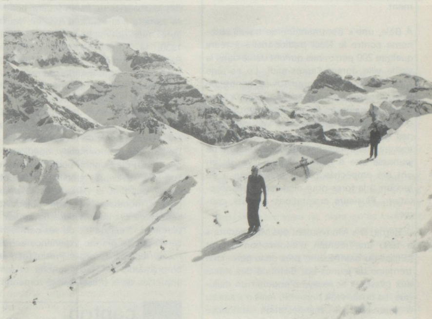
Adelboden dans l'Oberland bernois. Une des plus belles régions de ski au-dessus de la station est le Laveygrat à 2200 m.