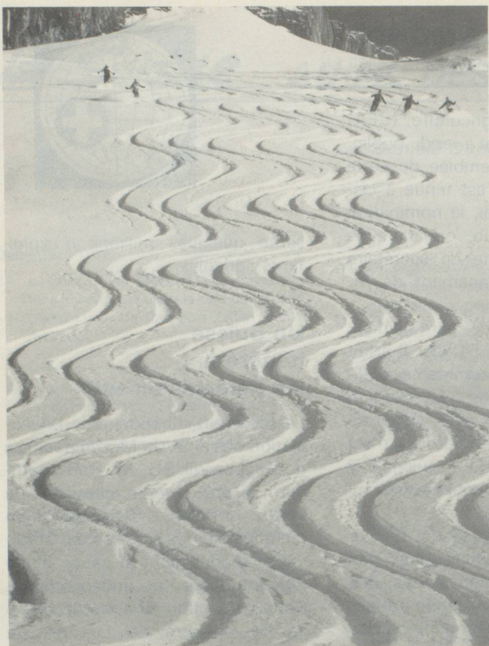
Décorations éphémères sur la neige. Souvenirs inoubliables de vacances passées en Suisse