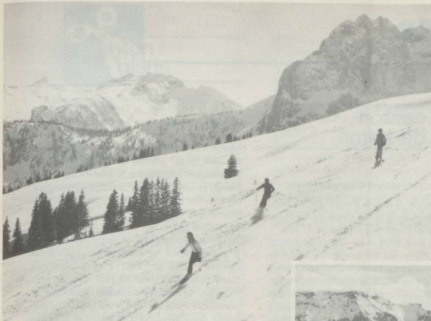
Rougemont dans les Alpes vaudoises. Depuis la région de ski bien connue de la Videmanette, il y a 6 pistes, au total 50 km pour descendre dans la vallée.