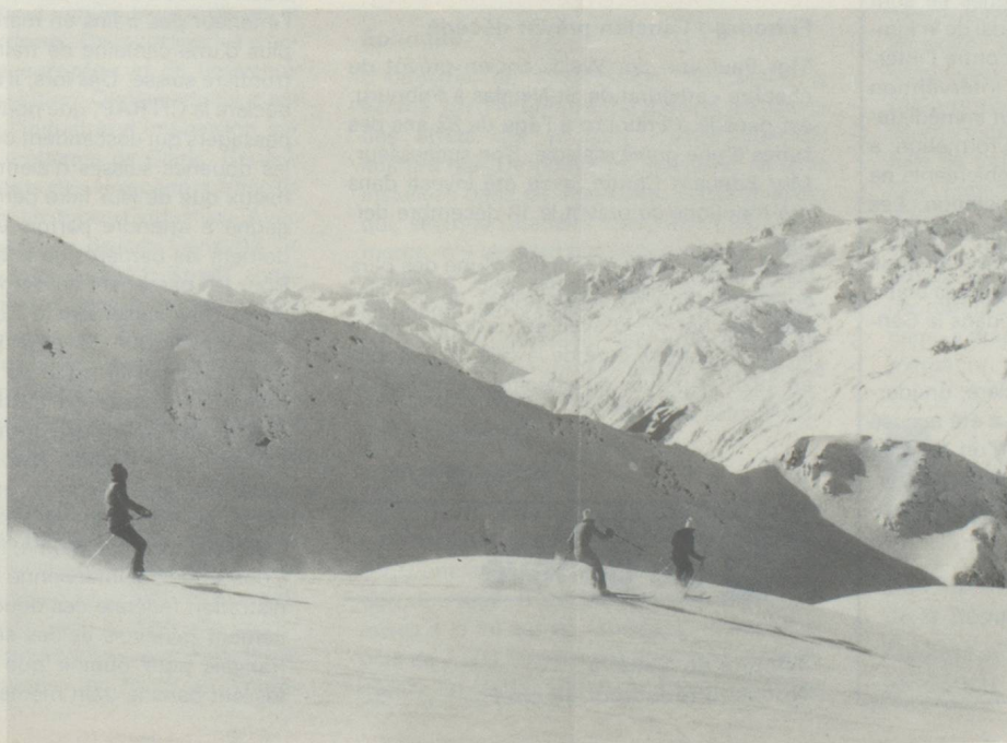
Andermatt en Suisse centrale. Sur la piste de Gems- stock, les skieurs glis- sent jusqu'à la station de vacances, située 1500 m plus bas.