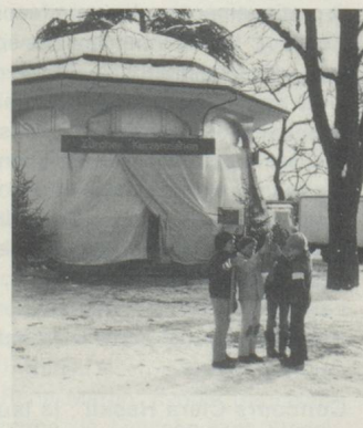
Durant l'Avent, le pavillon de musique sur la Bürkliplatz à Zurich attire toutes les années des centaines de fabricants de bougies en herbes. ▲