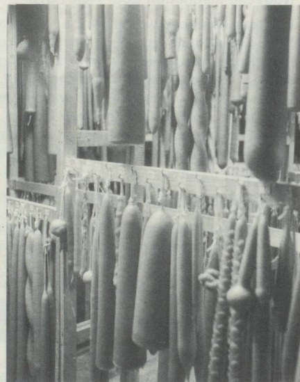
Aux heures de pointe, jusqu'à 3 000 kg de bougies de toutes formes et dimensions sont gardés en dépôt.