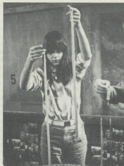
Coup double pour les débrouillards !