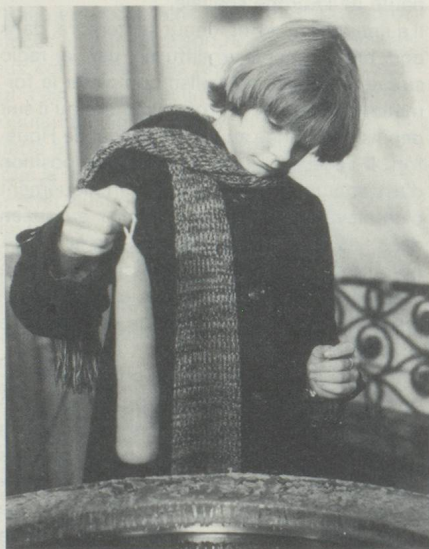
Après chaque immersion, la bougie épaissie d'une couche de cire doit être refroidie.