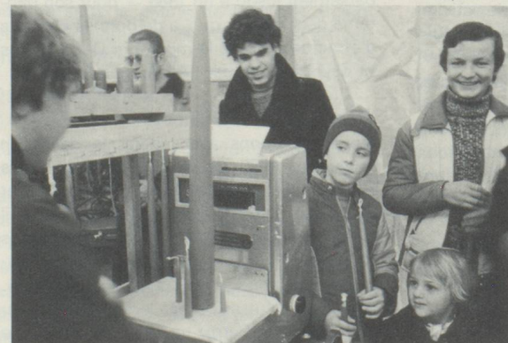
Les « fabricants » de bougies sont bien curieux de savoir le poids de leurs chefs d'œuvre... et donc ce qu'ils coûteront. ▲