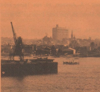
Union suisse de l'Ouest