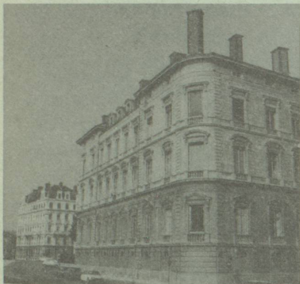
Le Consulat général de Suisse porte à votre connaissance :