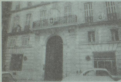
Consulat général 7, rue d'Arcole Tél. : (91) 53-36-65