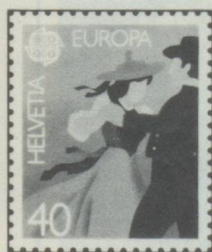
Tanzpaar Couple de danseurs Coppia di danzatori

Les PTT suisses choisirent cette année, pour la série Europa, le folklore comme motif : Un couple de danseurs, en costume folklorique, pour le timbre de 40 Cts et un lanceur de pierre, pour le timbre de 80 Cts. A la fête annuelle des bergers, à Unspunnen près d'Interlaken (Be), le moment le plus attendu du concours des lanceurs de pierre, est celui du fameux lancer de la « Pierre d'Unspunnen », d'un poids de 83,500 kg. Déjà connu au Moyen Age, c'est en 1805 que fut rendu hommage à cette coutume des bergers, et une pierre portant les dates : 1805-1905 immortalise la 1 re fête officielle et son centenaire.