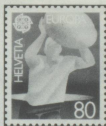
Steinstosser Lanceur de pierre Lanciatore di pietra

Entwürfe Dessins Walter Haettenschweiler, Zug Disegni