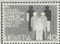
40 c. Internationales Jahr des Behinderten Année internationale de l'handicapé Anno internazionale dell'invalide Rolf Mosch, Reinach