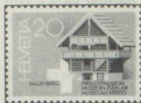
20 c. Freilichtmuseum Ballenberg Musée en plein air du Ballenberg Museo all'aperto di Ballenberg Arnold Wittmer, Luzern

Ausgabetag Jour d'émission Giorno d'emissione 9.3.1981