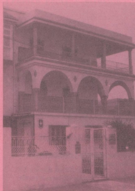
Ambassade de Suisse 1002 — TUNIS Belvédère Mutuelleville 10, rue Ech-Chenkiti Tél. : 281.917 — 280.132 Télex 12447