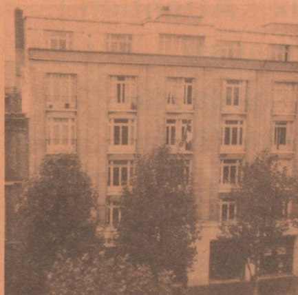
CONSULAT : 124, boulevard de Strasbourg Tél. : (35) 42.27.09