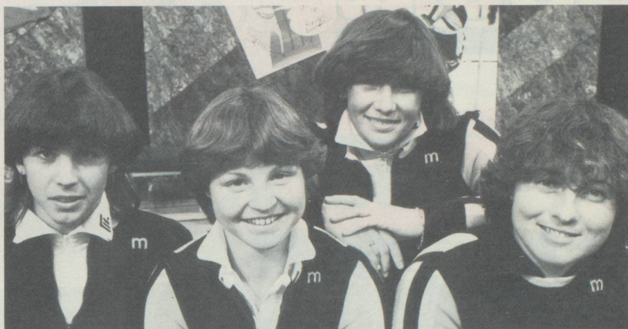
De g. à d. Doris de Agostini, Erika Hess, Maria Walliser et Marie-Thérèse Nadig.

Cette mignonne jeune fille de Mosnang dans le Toggenbourg qui vient de fêter ses 18 ans le 27 mai a disputé sa première saison entière en coupe du monde. Son succès a été éclatant. Elle a conquis ses premiers points dans la première compétition du Val d'Isère et à la fin de la saison cette spécialiste des courses à portes avait récolté des points dans toutes les disciplines et était la nouvelle venue de la saison la plus couronnée de succès. Pétillante d'ambition et de plaisir à skier, Maria Walliser qui aime passionnément les chevaux et vient, malgré les fatigues de la compétition mondiale, de terminer son apprentissage de commerce avec la mention bien, nous expliquait: «Ce n'est que maintenant que j'ai vraiment