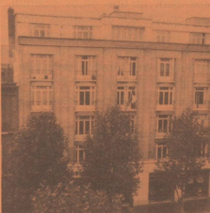
CONSULAT : 124, boulevard de Strasbourg Tél. : (35) 42.27.09