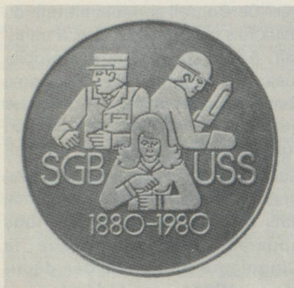
Un siècle d'union syndicale suisse 1880-1980