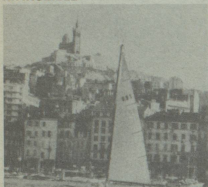
Consulat général 7, rue d'Arcole Tél. : (91) 53-36-65

Belle journée pour la colonie suisse de Marseille célébrant la fête nationale du 1er août (dimanche 27 juillet 1980)