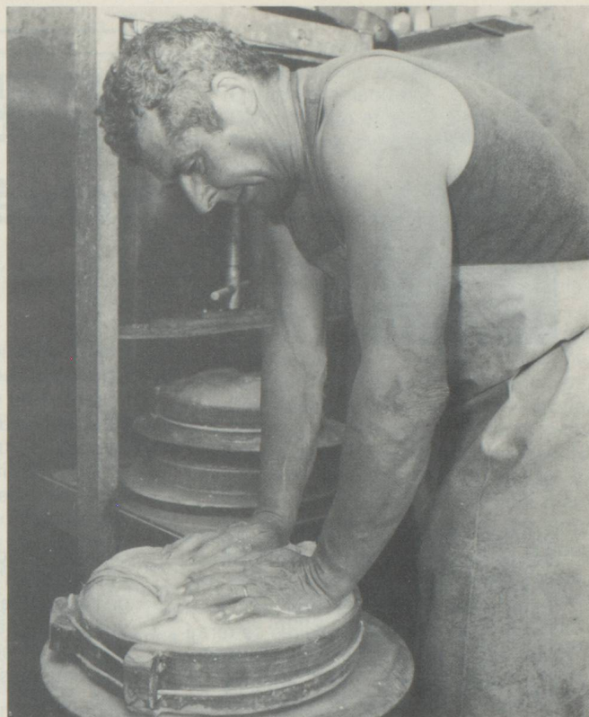
Un fromage à raclette — appelé ici Gommer — pèse en moyenne 6 kg, ce qui correspond à 60 litres de lait.

Riederalp, station de vacances valaisanne, repose sur un plateau élevé dans la région d'Aletsch, au centre d'une magnifique zone de randonnées où l'économie alpine et agricole reste florissante. Les prairies couvrant toute la montagne sont encore utilisées de manière très intensive et les pâturages éloignés sont réservés au jeune bétail ainsi qu'aux moutons, Riederalp, que l'on peut atteindre avec le téléphérique au départ de Mörel, est un alpage où le touriste peut encore jouir des sonnailles et participer aussi à la vie des vachers.