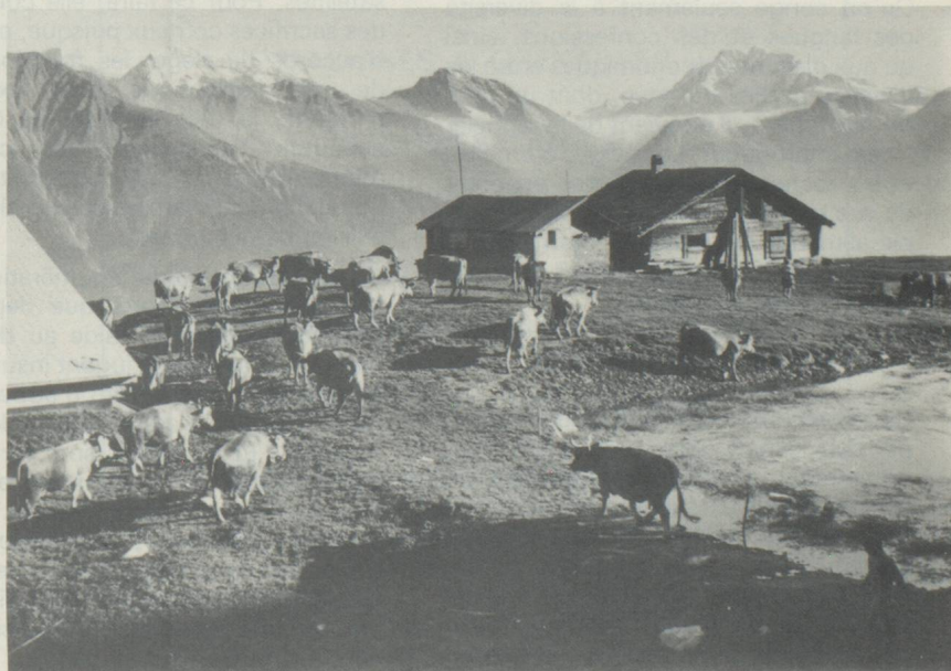
Contrairement aux veaux et génisses qui restent tout l'été en plein air, les vaches sont rentrées à l'écurie pour la traite et la nuit.

Riederalp, station de vacances valaisanne, repose sur un plateau élevé dans la région d'Aletsch, au centre d'une magnifique zone de randonnées où l'économie alpine et agricole reste florissante. Les prairies couvrant toute la montagne sont encore utilisées de manière très intensive et les pâturages éloignés sont réservés au jeune bétail ainsi qu'aux moutons, Riederalp, que l'on peut atteindre avec le téléphérique au départ de Mörel, est un alpage où le touriste peut encore jouir des sonnailles et participer aussi à la vie des vachers.