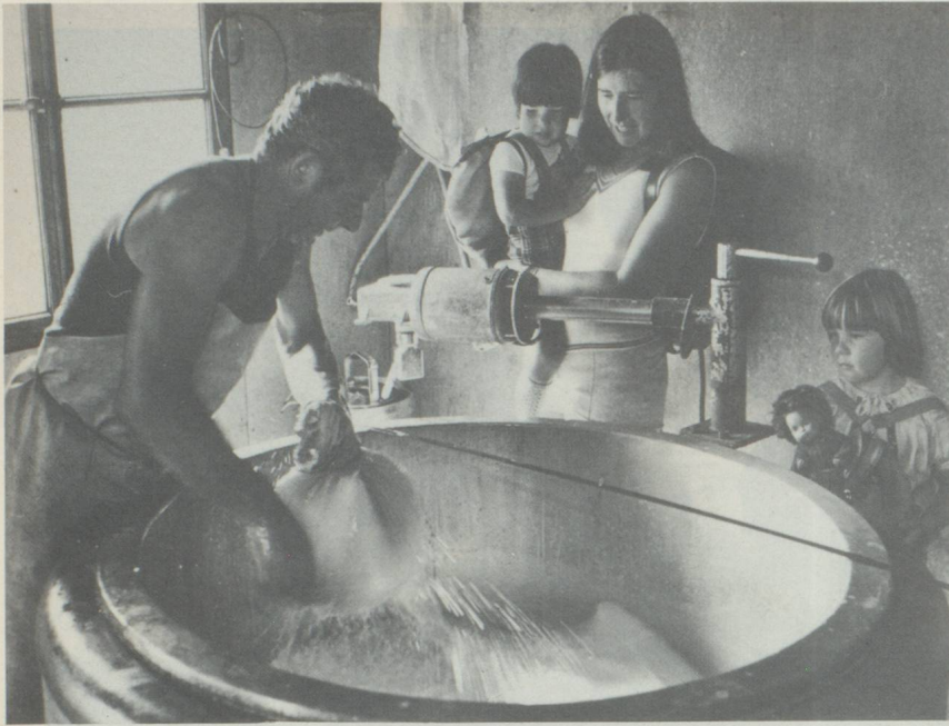
Pendant la saison d'été, les vacanciers peuvent visiter la fromagerie alpine chaque jeudi et goûter ensuite les produits laitiers en partageant les neuf heures du berger.

bien connu. La fête des bergers qui a lieu chaque année au début d'août est une attraction pour les gens du pays et les touristes.