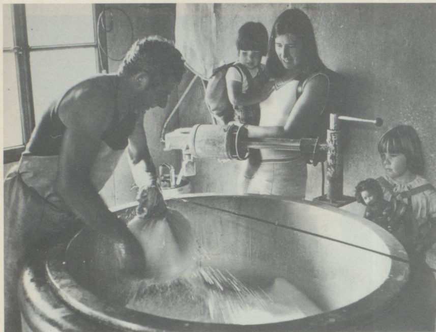
Pendant la saison d'été, les vacanciers peuvent visiter la fromagerie alpine chaque jeudi et goûter ensuite les produits laitiers en partageant les neuf heures du berger.

bien connu. La fête des bergers qui a lieu chaque année au début d'août est une attraction pour les gens du pays et les touristes.