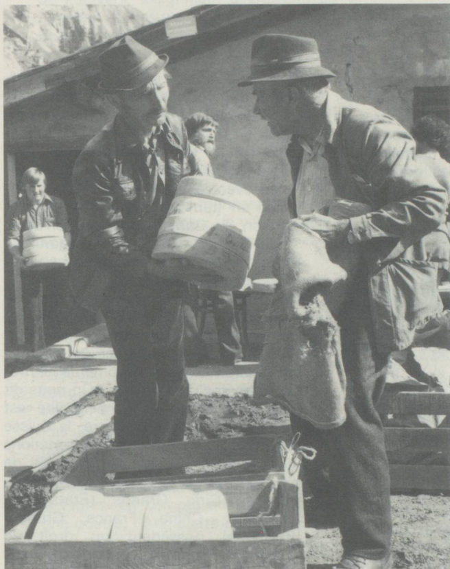
La première répartition des fromages entre les membres du syndicat des bergers a lieu en août, les meules restantes sont distribuées au moment de la descente de l'Alpe.