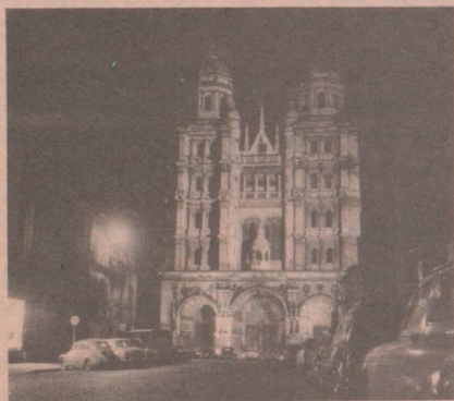
6, rue Rameau Tél. : 32-12-59