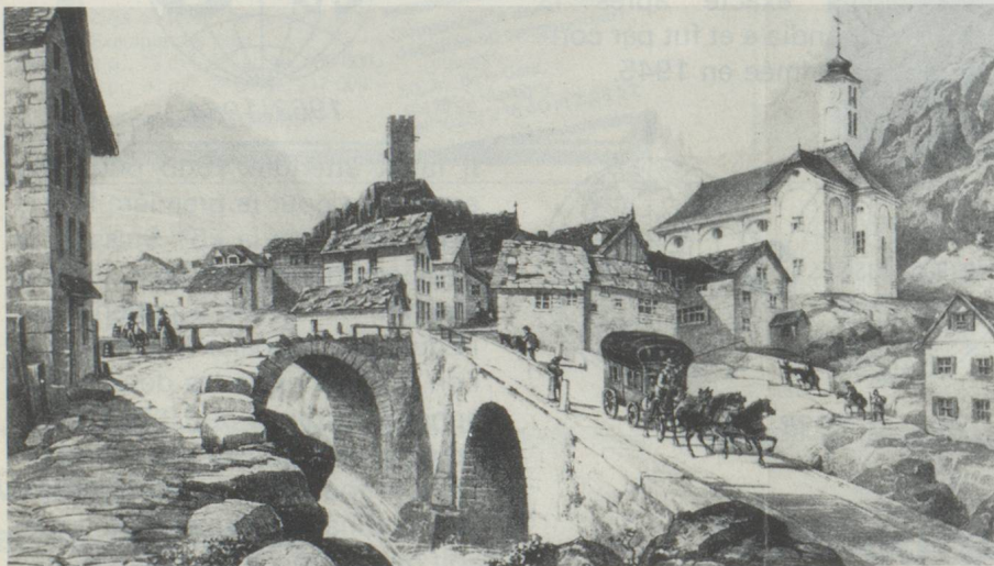
La diligence du St-Gothard passant en 1843 le village d'Hospental

« Saint-Gothard – VIA HELVETICA » par Arthur Wyss, conservateur du Musée des PTT à Berne. Traduit par Amédée Torche, Fribourg (avec préface du conseiller fédéral Willy Ritschard). Cet ouvrage richement illustré et rédigé de façon captivante est une vaste fresque des faits qui ont contribué de manière décisive à l'histoire du Gothard, fresque qui met en relief les impulsions d'ordre politique que ce col a engendrées et qui ont profondément marqué le devenir de la Confédération suisse. Il est en même temps une profession de foi pour ce passage le plus central des Alpes. Ses quelque 300 illustrations – dont plus de 50 en couleurs – tirées d'images, de documents, d'anciens cachets et oblitéra-