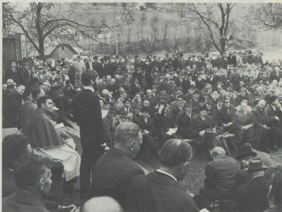
Landsgemeinde à Stans

du canton, ne reçoit pour ainsi dire pas de soleil durant les mois de décembre et de janvier.