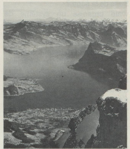
Vue sur le Bürgenstock et le lac des Quatre-Cantons

gemeinde». Chaque dernier dimanche d'avril elle est ouverte par les mots: «Getriiwi, liebi Landsliit» (chers et fidèles compatriotes). Cette réunion se tient à Wil an der Aa où l'on procède à l'examen et à la discussion des affaires canto-