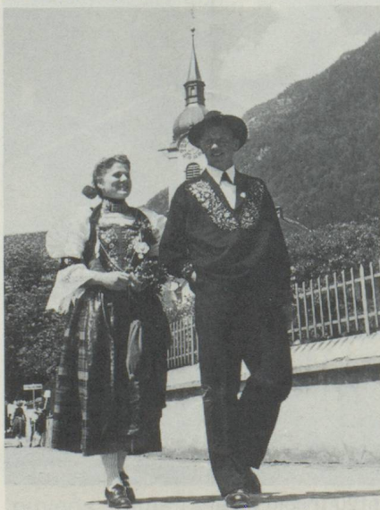
Couple en costume traditionnel du Canton de Nidwald