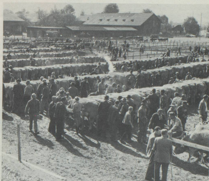
Marché aux bestiaux à Wil

nales, suivis de votations et d'élections. Le grand nombre et surtout la complexité des objets deviennent de plus en plus difficiles à être traités dans la forme actuelle. Cela conduit à une oligarchie vu que les citoyens voient leur rôle se borner à suivre le point de vue de la minorité dirigeante. Il faut aussi prendre garde à ce que la Landsgemeinde ne devienne pas purement et simplement une manifestation folklorique.