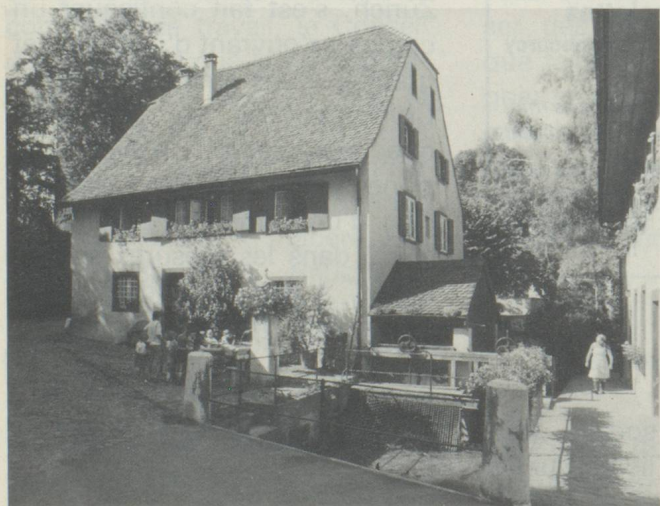
« Gruen 80 » à Bâle.

2 e Exposition suisse d'horticulture et de paysagisme.