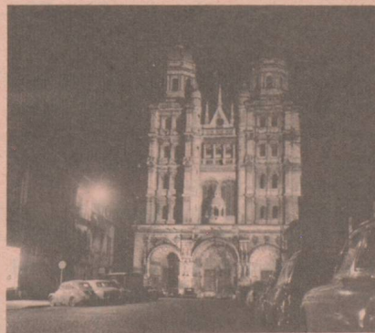
6, rue Rameau Tél. : 32-12-59