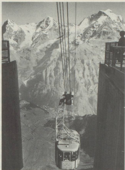
Vue depuis le Schilthorn sur l'Eiger, le Mönch et la Jungfrau

sur ses privilèges impériaux et sur les droits de seigneurie et de justice détenus auparavant par la noblesse depuis l'époque féodale, que Berne s'érige peu à peu en Etat. Sachant doser son pouvoir, Berne laisse le pays s'administrer. En 1528, la Réformation affermit l'emprise de l'Etat en lui ouvrant de nouveaux champs d'activité, tels que l'assistance, l'instruction et la police des mœurs; c'est elle aussi qui, grâce à l'Eglise d'Etat réformée, crée pour la première fois une communauté englobant uniformément tous les habitants du pays. En 1798, la chute de l'ancien Régime entraîne de grandes pertes territoriales. En 1815, le Congrès de Vienne attribue à Berne une grande partie de l'ancien Evêché de Bâle (le Jura) en compensation du Pays de Vaud et de la Basse-Argovie, et le canton redevient mixte en matière linguistique et – nouveauté – sur le plan confessionnel. La transaction s'est faite sans l'avis des Jurassiens. Mais, maintenant, les Jurassiens ont eu l'occasion de choisir leur destinée.