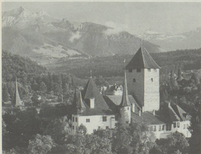
Le château de Spiez, fief de la dynastie des Bubenberg de 1338 à 1516