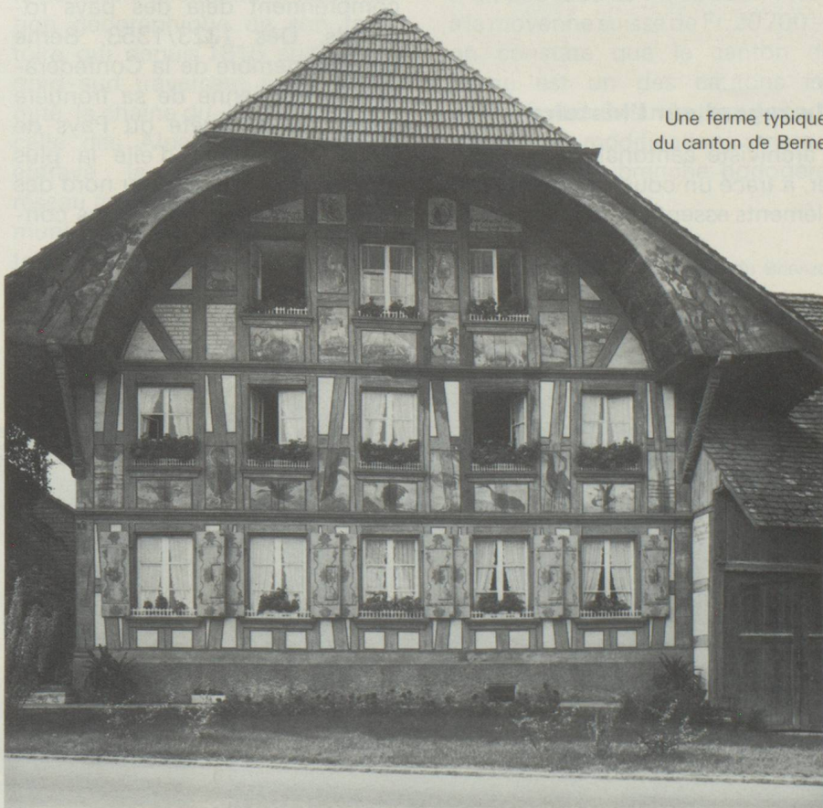
Une ferme typique du canton de Berne

Avec ses 410 communes réparties en 27 arrondissements, le canton de Berne est une Suisse en petit. Il s'étend sur les 3 structures géologiques helvétiques: Jura, Plateau et Alpes. La langue française est employée dans sa partie nord, alors que Bienne est l'exemple typique d'une ville où l'on parle 2 langues le suisse allemand, plus exactement le «Bärndütsch», régnant en maître dans le reste du canton. Celui qui pense que le «Bärndütsch» est une langue homogène se trompe lourdement, car c'est un des attraits du suisse alle-