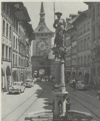
Berne, Marktgasse avec la fontaine de l'Arquebusier et la célèbre Tour de l'horloge

Si aujourd'hui, un citoyen helvétique insatisfait se plaint de «ceux de Berne», il fait allusion presque exclusivement aux autorités fédérales et à leur administration qui sont concentrées en la ville fédérale. Il existe bien sûr un «autre Berne», soit un Etat membre de la Confédération au même titre que chacun des autres cantons dont le Saint-Gallois Carl Hilty, qui fut professeur de droit à l'Université de Berne, voici exactement 100 ans, disait: «Berne est le seul véritable canton de la Confédération, portant en lui une majesté souve-