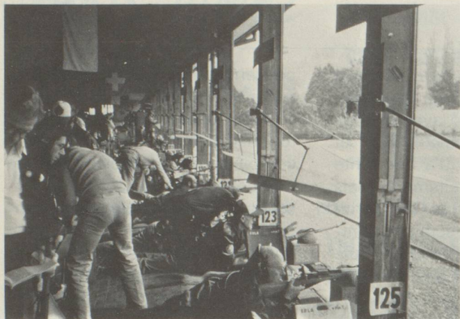
Au stand de l'Allmend