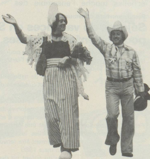
Hollande et Etats Unis, une belle image de Suisses de l'étranger lors du cortège officiel

Quel plaisir de voir aligner les coups dans le noir, promettant une médaille tant convoitée et que nombreux arboraient ensuite avec fierté, alors que quelques-uns ne tarissaient point de conter cette «maudite pendule» qui leur avait fait perdre le bénéfice d'un trophée.