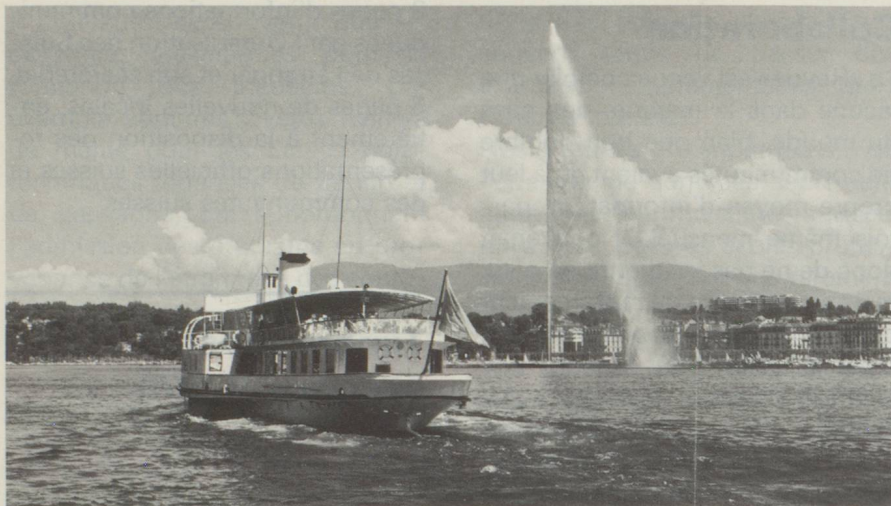
Le jet d'eau de Genève, haut de 140 m