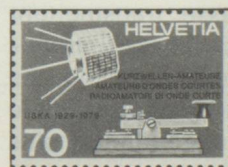
70 c. Cinquantième de l'Union des amateurs suisses d'ondes courtes