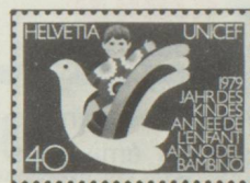
40 c. Année internationale de l'enfant