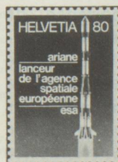
80 c. Agence spatiale européenne ESA