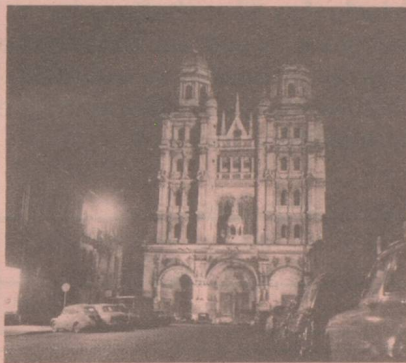
6, rue Rameau Tél. : 32-12-59